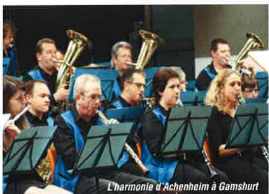
L'harmonie d'Achenheim à Gamshurt

Le 12 avril 2014 , c'est devant une salle comble que l'Harmonie municipale a donné son concert annuel en ce samedi printanier à l'image de la bonne humeur d'un public qui a su répondre présent.